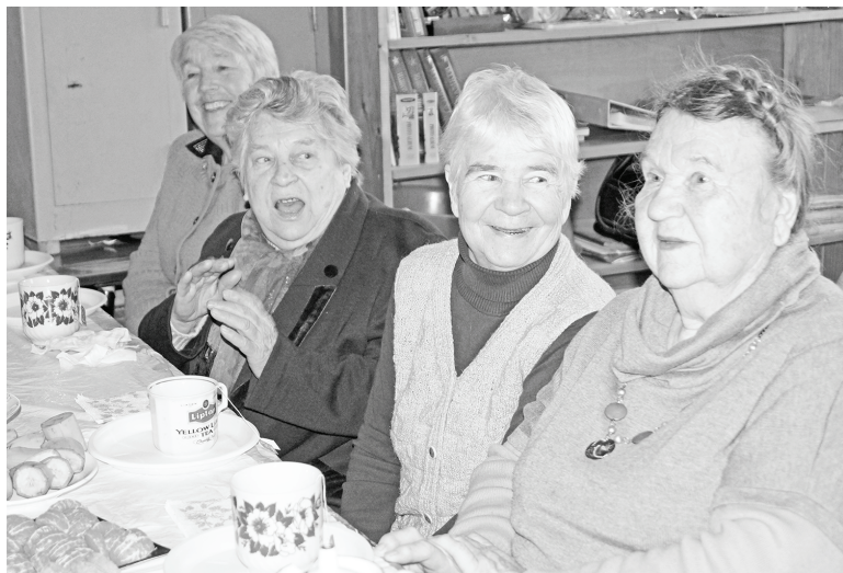
Разговор за чашкой чая.