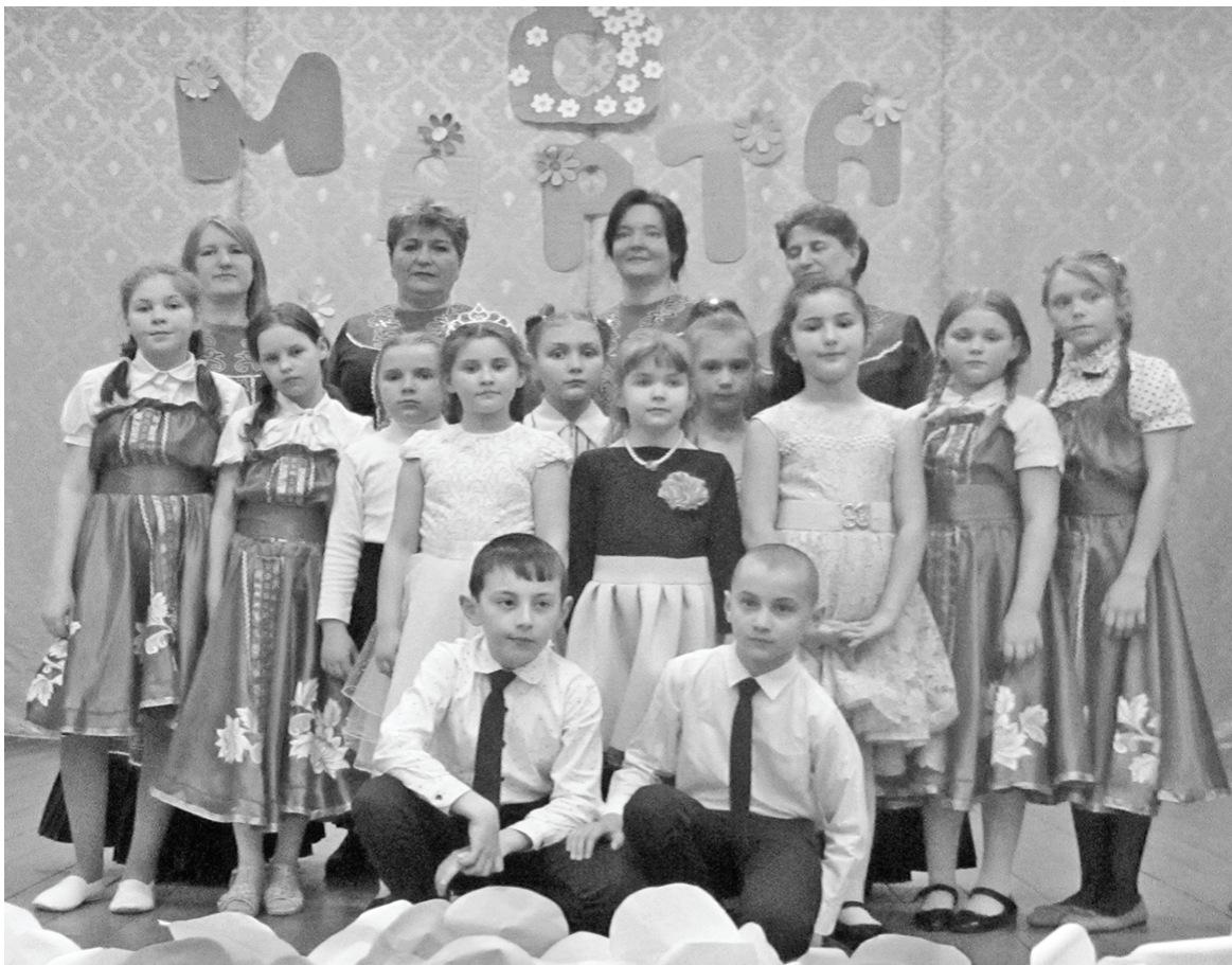
8 Марта в Паликовском СДК.