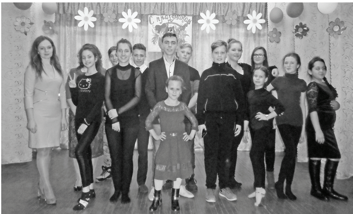
Участники весеннего праздника в п.Новый.

евич обратился ко всем женщинам, присутствующим в зале: «Дорогие наши женщины, свои праздничные букеты вы поставите в вазы, но рано или поздно они засохнут, а наш поздравительный букет останется у вас в памяти. Мы