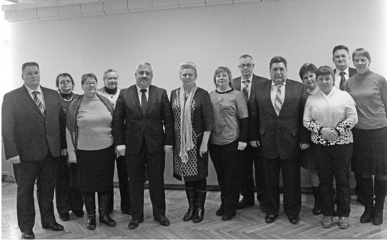
Делегация Думиничского района.

6 марта в Калуге прошел VIII съезд депутатов представительных органов муниципальных образований области, а также XIII съезд Совета (Ассоциации) муниципальных образований.