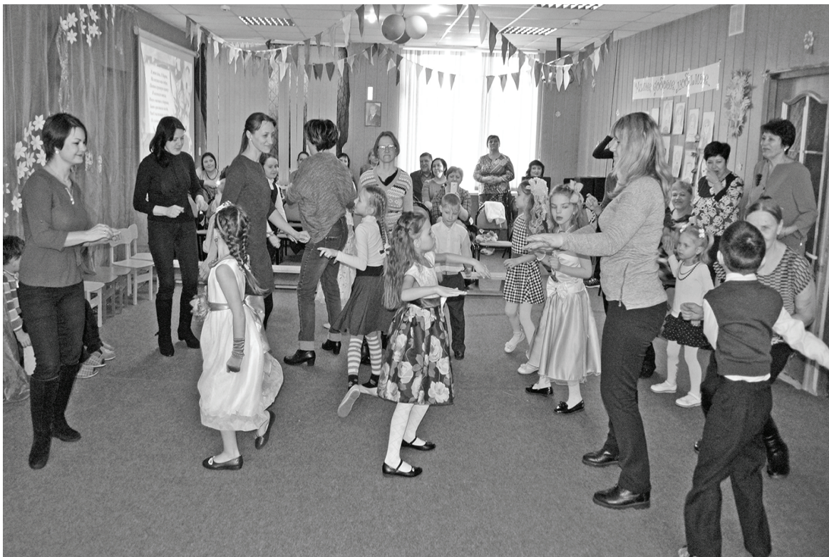
Праздник в Центре социальной помощи семье и детям.