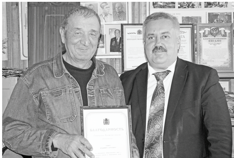
Благодарность за многолетний труд.